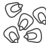
Maíz en grano Nomenclador: 100590