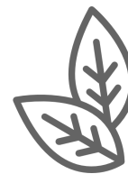
Tabaco Burley Nomenclador: 240120