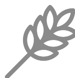
Trigo Nomenclador: 100199