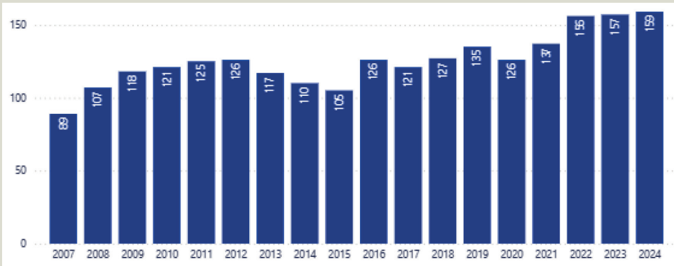
Gráfico 3 Establecimientos empleadores de EDC de Tucumán por año

Es acertado analizar a las empresas empleadoras por sectores, se advierte que, en 2024, la mayor proporción se concentró en el SSI con el 76,5% del total, seguido por el SEPT con el 16,5% y por último el sector de Biotecnología con el 7,1%. Así también se puede observar, que EDC posee una fuerte presencia en microempresas con el 79,8% y que aún no figuran grandes empresas en este escenario (Tabla 2).